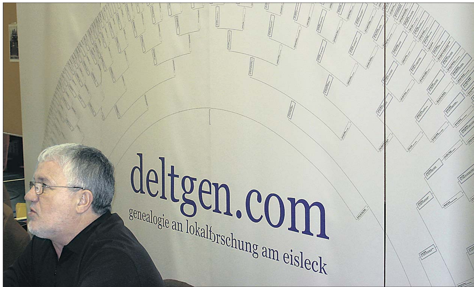
L'actuel trésorier de l'association Luxracines devant l'impressionnante Ahnentafel de sa famille qu'il expose dimanche sur son stand personnel à l'occasion de la Journée nationale. Le tableau en question représente neuf générations successives, soit un bon millier d'ancêtres en ligne directe, étant entendu que l'auteur de cet arbre ancestral connaît encore davantage d'aïeux qu'il ne sait ajouter à la présentation graphique, pour des raisons techniques évidentes.

Le nombre de chercheurs luxembourgeois exposant aux Journées se développe d'année en année, notamment pour ce qui