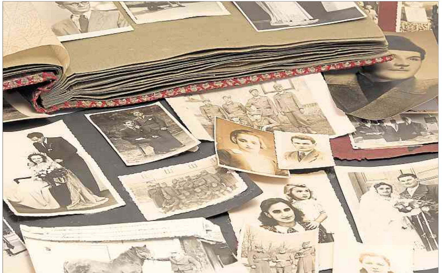
Aus datenschutzrechtlichen Gründen können über Luxroots nur Daten bis 1914 eingesehen werden.

1985 kaufte sich Eicher einen solchen – drei Jahre lang besuchte er Abendkurse, um das Programmieren von Datenbanken zu erlernen. Und um eine Ahnenforschungssoftware zu entwickeln, die es bis dahin nicht gab. Zwar folgte eine zehnjährige Abstinenz von diesem Thema, aber die Jahre waren alles andere als fehlinvestiert. Denn die zwischenzeitlichen Technikfortschritte – Internet und